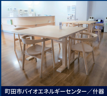
町田市バイオエネルギーセンター／什器