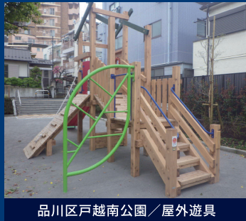
品川区戸越南公園／屋外遊具