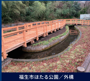
福生市ほたる公園／外構