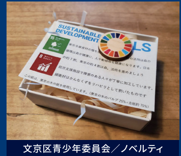
文京区青少年委員会／ノベルティ