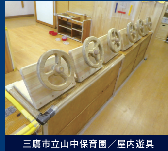
三鷹市立山中保育園／屋内遊具