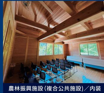
農林振興施設(複合公共施設)／内装