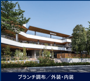
ランチ調布／外装・内装