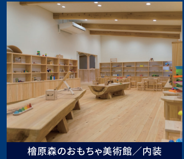
檜原森のおもちゃ美術館／内装