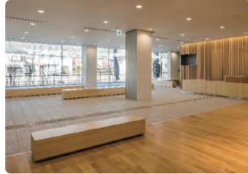
日野市立南平体育館エントランス/ 内装