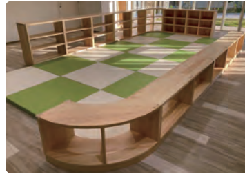
世田谷区立教育総合センター/ 什器