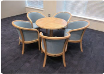
海の森水上競技場/ 什器