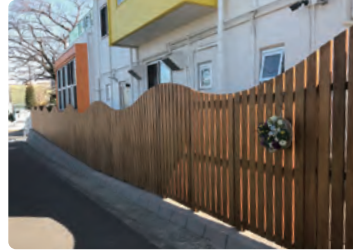
社会福祉法人町田南保育園/ 外構