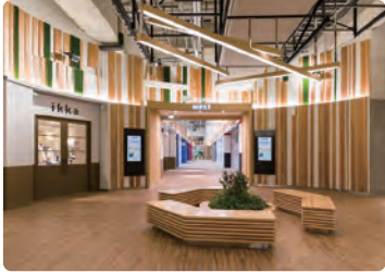
nonowa 東小金井 WEST/ 内装