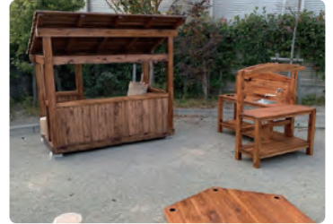
杉並の家さくら保育園/ 屋外遊具